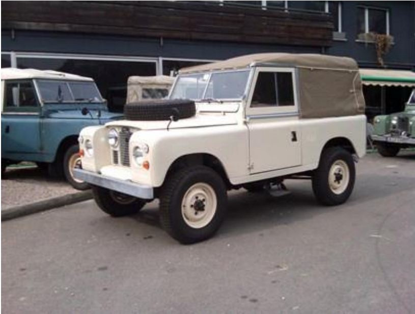
Defender 90 mit Serie2 Optik, gab es so nie... ...außer bei LandyPoint