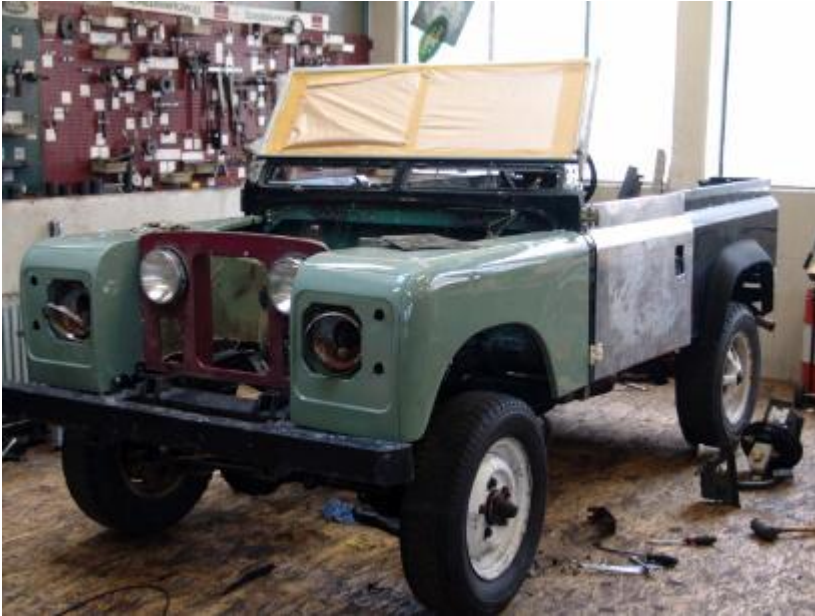
Grob zusammengestelltes Fahrzeug.

Defender Rahmen und Spritzwand, Serie Maske und Kotflügel.